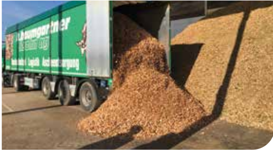
Silobefüllung mit Holzschneitzel aus dem umliegenden Wald