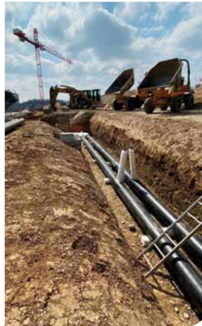
Erstellung des Leitungsnetzes vor der Heizzentrale