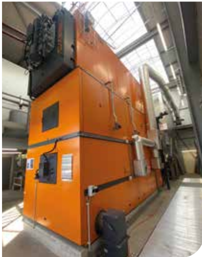
Heizzentrale an der Ifangstrasse