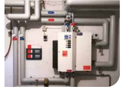
Wärmeübergabestation in der Liegenschaft, sauber und kompakt (Bild: MFH mit 12 Wohnungen)