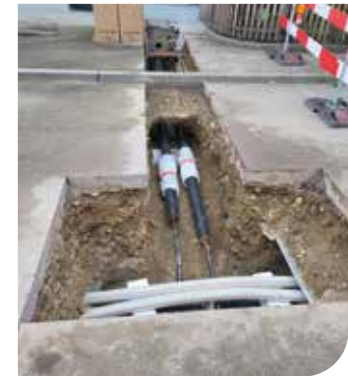
Hausanschluss in der Realisation